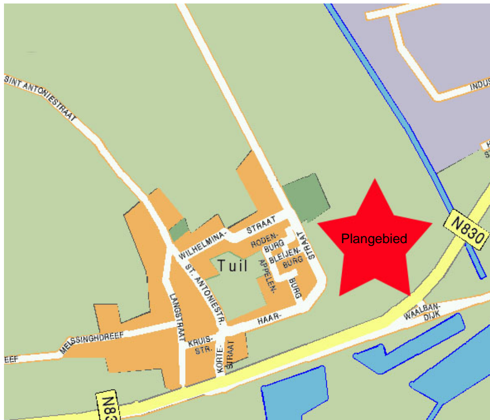
Ligging plangebied in Tuil