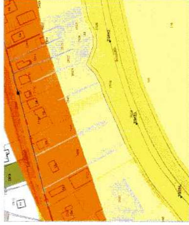
SITUATIE BESCHERMINGSZONE WATERSCHAP