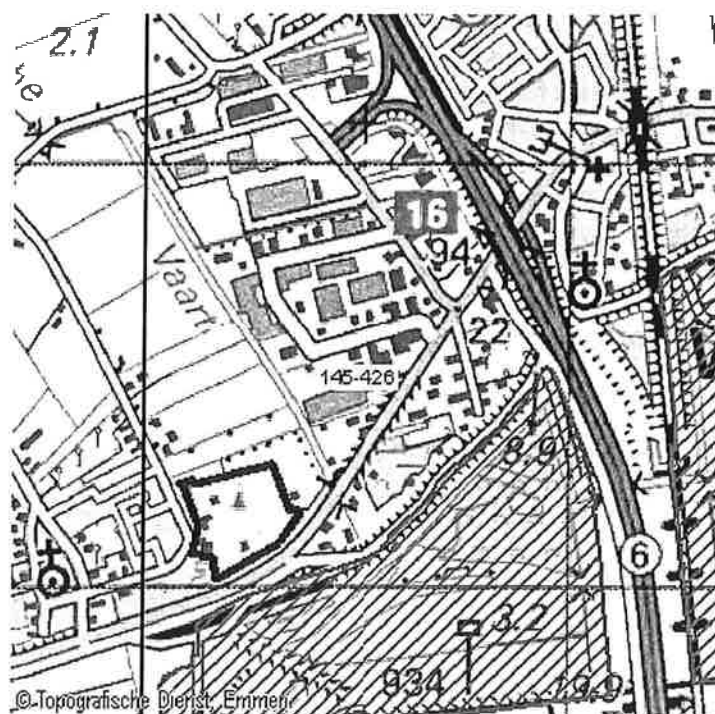
Figuur 1 Het plangebied (blauw omlijnd) is gesitueerd tegen de rand van bebouwde kom van Tuil, binnen het kilometerhok 145-426. Het gearceerde gebied vormt een onderdeel van het habitatrictlijngebied 'Rijswaard en Kil van Hurwenen' en het vogelrichtlijngebied 'Waal'.

In opdracht van Van Dijk Geo- en Milieutechniek b.v. te De Meern, heeft Koeman en Bijkerk bv ecologisch onderzoek verricht in verband met de voorgenomen herinrichting van de locatie 'Haarstraat 6' te Tuil, gemeente Neerijnen. Het plangebied heeft een oppervlakte van circa 8 ha en ligt juist ten oosten van de bebouwde kom. Momenteel wordt het gebied gebruikt als camping. De bestemming is nieuwbouw. Het plangebied bevindt zich binnen het kilometerhok met de Amersfoort coördinaten 145-426 (Figuur 1). Een kilometerhok is een vastgelegd gebied van 1x1 km dat als standaard dient voor het inventariseren van de flora en fauna door de Particuliere Gegevensbeherende Organisaties (PGO's).